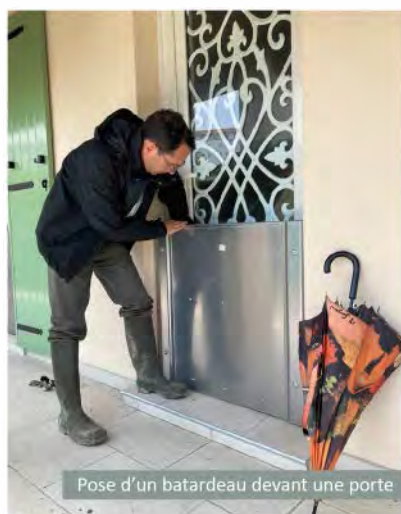
Pose d'un batardeau devant une porte

Le risque inondation concerne plus de 50 000 habitants sur le bassin versant des Gardons. L'EPTB Gardons est en charge de la prévention de ce risque sur ce territoire pour le compte des communautés de communes et d'agglomération.