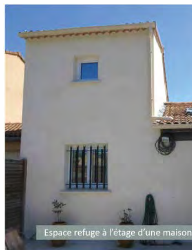
Espace refuge à l'étage d'une maison